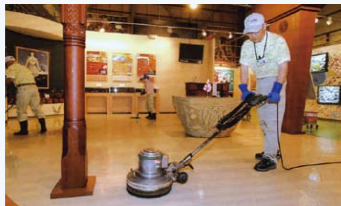
清掃管理(愛地球博イベント会場)