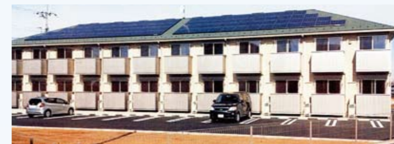
宅地建物取引業免許を取得して総合管理体制を確立

当社のFM事業は、お客様が所有されている建物及び不動産の総合的な運営管理を担い、効率的に運用管理する業務です。